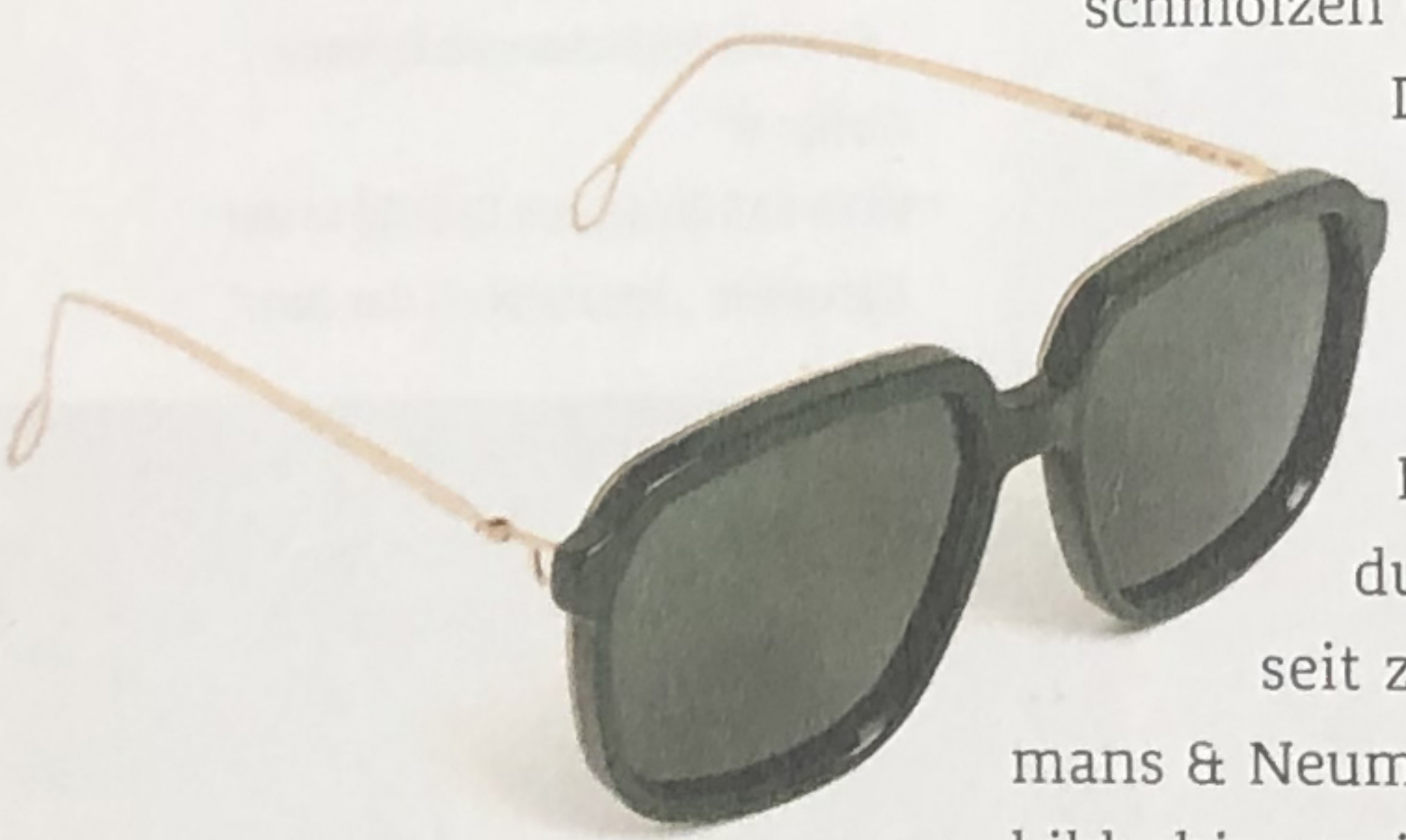
Spannungsvoll aufgeladen und edel: Modell Emilio