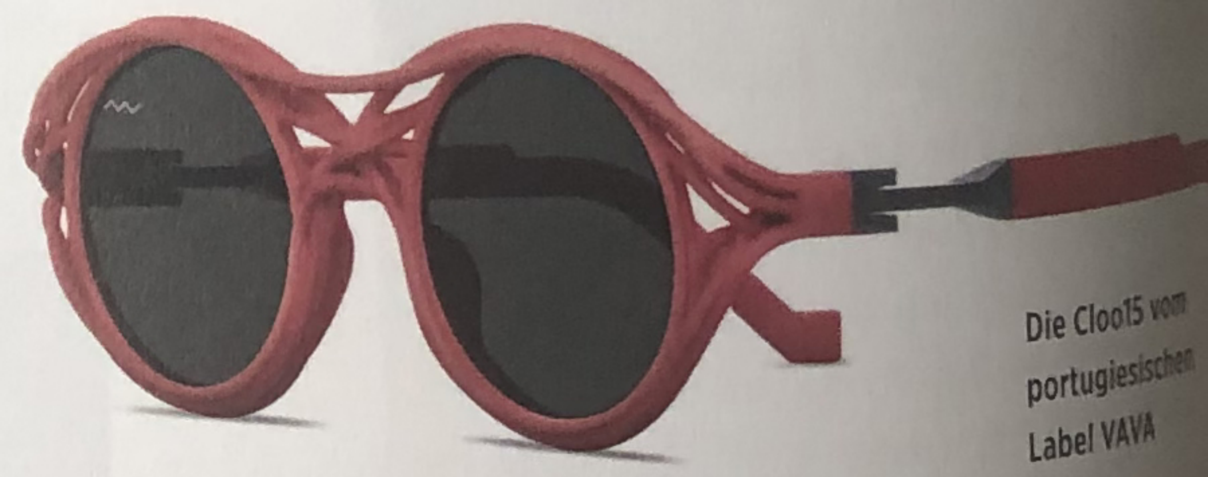
Die Cloo15 vom portugiesischen Label VAVA

Vor manchen Brillen möchte man sich verbeugen, dabei sollte man sie doch aufsetzen. Die Cloo15 von VAVA zum Beispiel. Das Design der Sonnenbrille ist mandelförmig, der 3D-